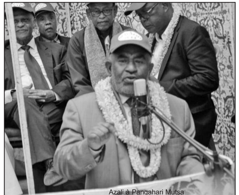
Azali à Pangahari Mutsa

Direction de campagne du candidat Azali Assoumani