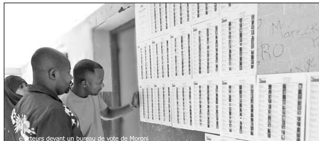
électeurs devant un bureau de vote de Moroni